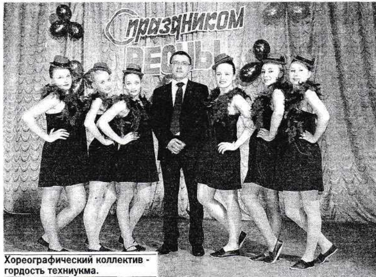
Хореографический коллектив - гордость техникума.